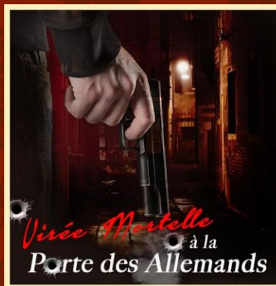
Virée Mortelle à la Porte des Allemands (3 salles de jeu)